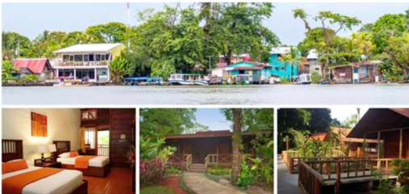
23.1.2022 - Puerto Viejo de Talamanca - hotel BANANA AZUL - 3 noci