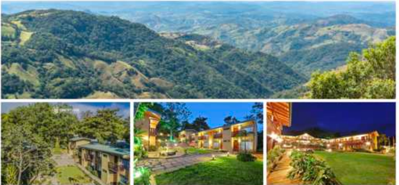
20.1.2022 - La Fortuna - hotel AUNTY ARENAL LODGE - 2 noci