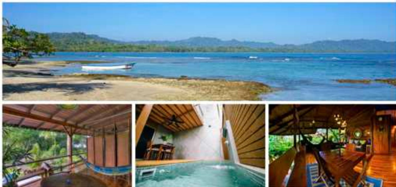
26.1.2022 - noční přejezd